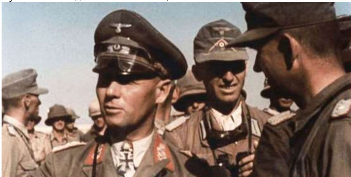
Генерал-лейтенант Эрвин Роммель в Ливии, 1942 год

А потом англичане остановились: им еще нужно было отправить войска в Грецию. Пришла очередь итальянцев использовать сберегательное перемирие и воспользоваться опцией «позвонить другу». В отличие от балканских приключений Муссолини, Гитлер считал свои планы в Северной Африке вполне разумными и немедленно оказал помощь.