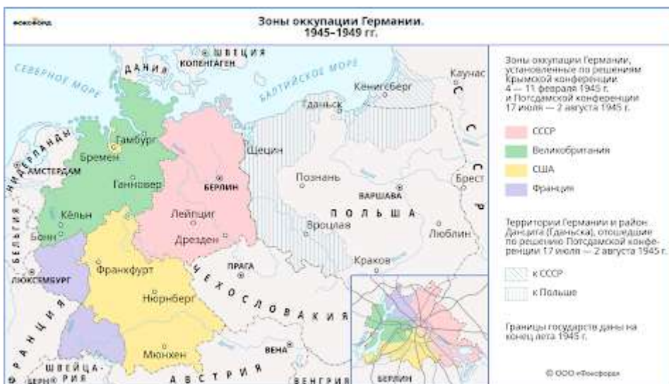
Зоны оккупации Германии (1945—1949). Автор 52 Pickur

На конференции было решено ликвидировать в Германии всю военную промышленность (демилитаризация) и нацистские организации (денацификация), а также переустроить политическую сферу под будущее (демократизация) и передать управленческие и экономические функции на средний и нижний уровни (децентрализация). Эти меры должны были исключить возможность Германии в будущем вернуться к нацизму и создать мощную военную экономику.